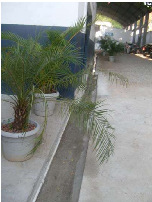
Fig.19 - Área Externa - Vala aberta para escoamento de águas pluviais.

SERVIÇO PÚBLICO ESTADUAL PROCESSO Nº E-26/30.437/2011 DATA: 27/01/2010 Fls. _____ RUBRICA _____