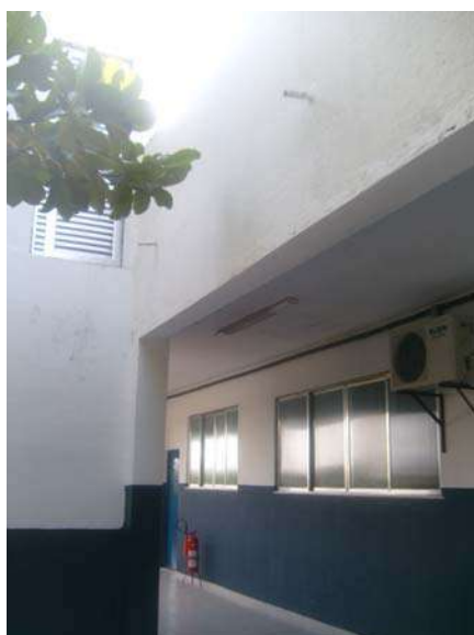
Fig 29 - Fachada – Buzinote jogando água na varanda, escorrendo para sala de aula.