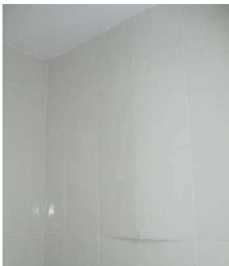
Fig 23 - Cozinha - Parede estufada

SERVIÇO PÚBLICO ESTADUAL PROCESSO Nº E-26/36.914/2011 DATA: 28/06/2011 Fls. _____ RUBRICA _____