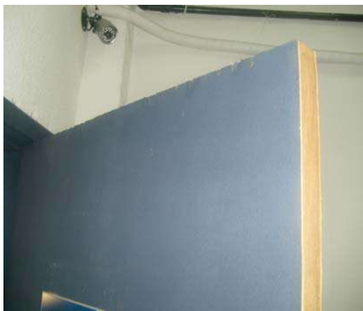
Fig 9: 1ª Pav - Porta danificada e mal pintada.