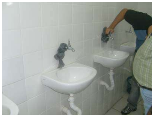
Fig 28 - Pias interditadas devido a vazamento no sifão.