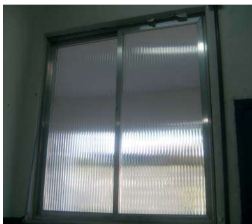
Fig 10: Janela de alumínio sem trinco

Divisão de Engenharia Rua Clarimundo de Melo, 847 – Quintino - CEP 21311-280 – (21) 2332-4091 – 2332-4052 DIENG@FAETEC.RJ.GOV.BR