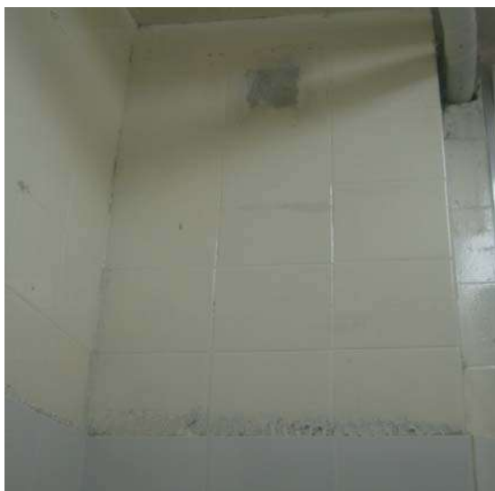
Fig 11 – Banheiro da direção - Dois tipos de azulejo e acabamento ruim.

SERVIÇO PÚBLICO ESTADUAL PROCESSO Nº E-26/30.437/2011 DATA: 27/01/2010 Fls. _____ RUBRICA _____