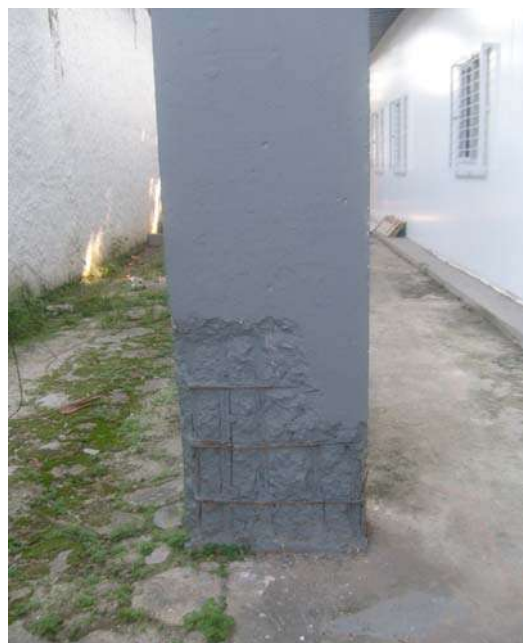
Fig 16 - Armação aparente sem tratamento necessário.