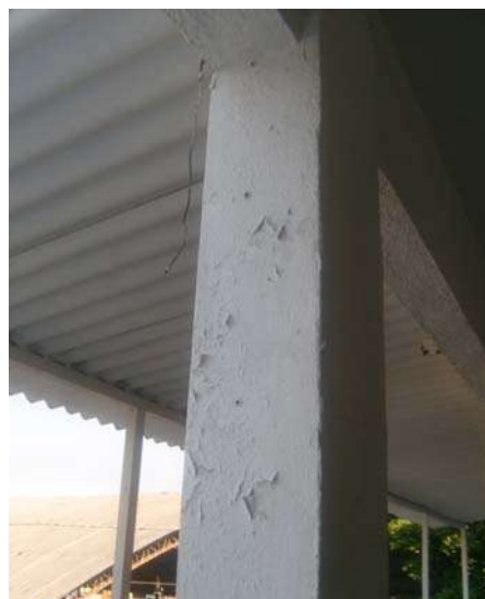
Fig.24 - Corredor 2 do 2ª Pav – Pintura deteriorada.