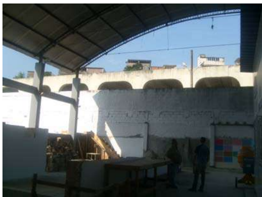
Fig. 17 - Canteiro da Construção Civil - Sem iluminação suficiente.