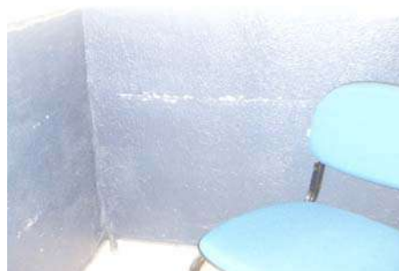
Fig 4: Recepção - Pintura danificada pelo mobiliário.