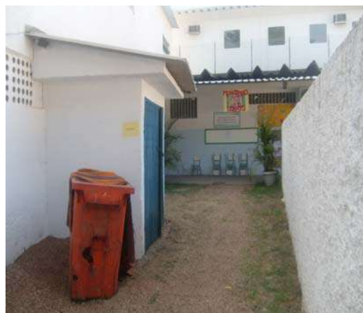
Fig 14 - Abrigo para gás sem ventilação suficiente.

Divisão de Engenharia Rua Clarimundo de Melo, 847 – Quintino - CEP 21311-280 – (21) 2332-4091 – 2332-4052 DIENG@FAETEC.RJ.GOV.BR