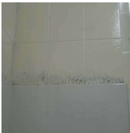
Fig. 13 – Banheiro da Direção - Detalhe do acabamento