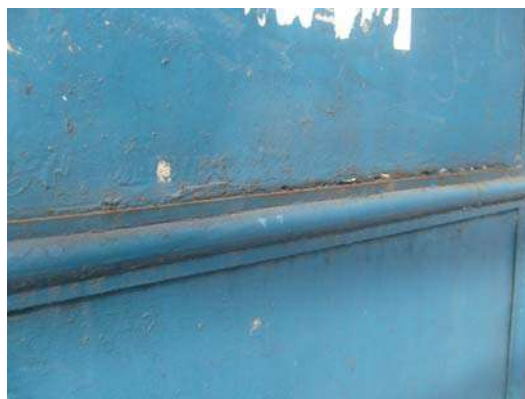
Fig 2: Detalhe do portão danificado por ferrugem

Divisão de Engenharia Rua Clarimundo de Melo, 847 – Quintino - CEP 21311-280 – (21) 2332-4091 – 2332-4052 DIENG@FAETEC.RJ.GOV.BR