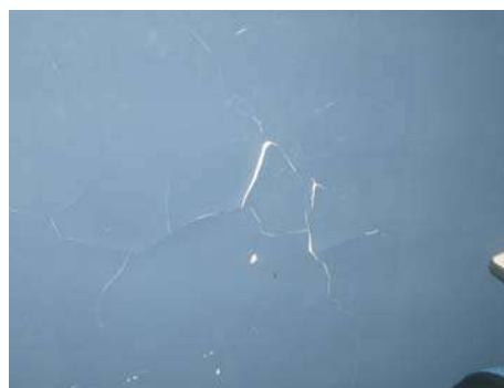
Fig 6: Adm - a massa esta soltando

Divisão de Engenharia Rua Clarimundo de Melo, 847 – Quintino - CEP 21311-280 – (21) 2332-4091 – 2332-4052 DIENG@FAETEC.RJ.GOV.BR