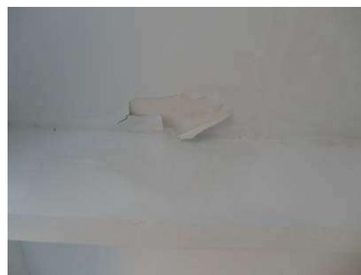
Fig.26 - Corredor do 2ª Pav - Pintura soltando devido a infiltração.

Divisão de Engenharia Rua Clarimundo de Melo, 847 – Quintino - CEP 21311-280 – (21) 2332-4091 – 2332-4052 DIENG@FAETEC.RJ.GOV.BR