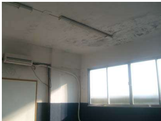
Fig.27 - Sala de aula do 2º Pav - Pintura danificada devido a infiltração.