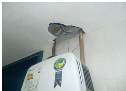
Fig 21 - Cozinha - Buraco no forro de gesso.