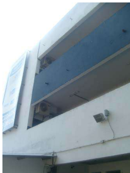
Fig 30 - Fachada - Buzinote jogando água na área externa.

Divisão de Engenharia Rua Clarimundo de Melo, 847 – Quintino - CEP 21311-280 – (21) 2332-4091 – 2332-4052 DIENG@FAETEC.RJ.GOV.BR