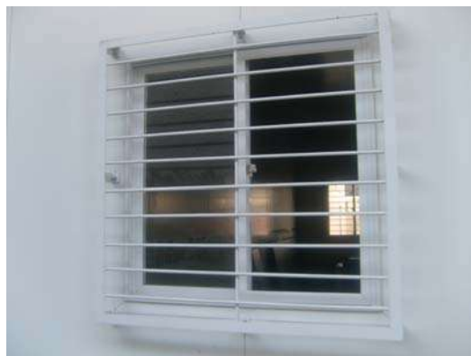
Fig. 18 - Lab. De Pintor - Uma folha das janelas sem vidro.

Divisão de Engenharia Rua Clarimundo de Melo, 847 – Quintino - CEP 21311-280 – (21) 2332-4091 – 2332-4052 DIENG@FAETEC.RJ.GOV.BR