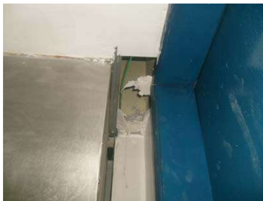
Fig 22 - Cozinha - Buraco no forro de gesso.

Divisão de Engenharia Rua Clarimundo de Melo, 847 – Quintino - CEP 21311-280 – (21) 2332-4091 – 2332-4052 DIENG@FAETEC.RJ.GOV.BR