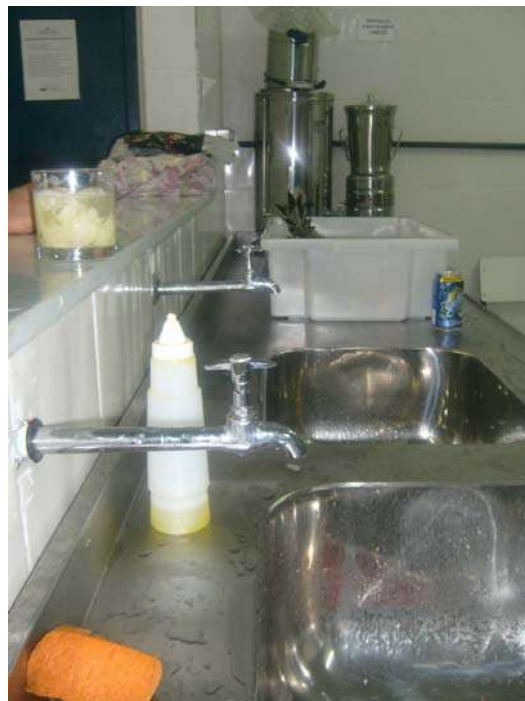
Fig. 20 – Lab. De Barman - Torneiras inadequadas em relação a cuba da pia.