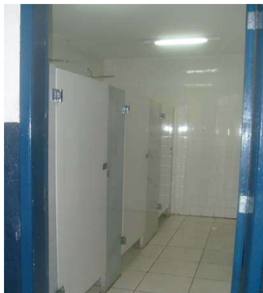
Fig 12 – Vestiário masculino sem mictório.