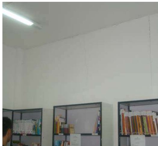
Fig 8: Sala de estudo - Massa trincada