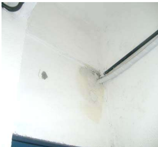
Fig 7: Sl. Da Direção - Acabamento ruim.

SERVIÇO PÚBLICO ESTADUAL PROCESSO Nº E-26/36.914/2011 DATA: 28/06/2011 Fls. _____ RUBRICA _____