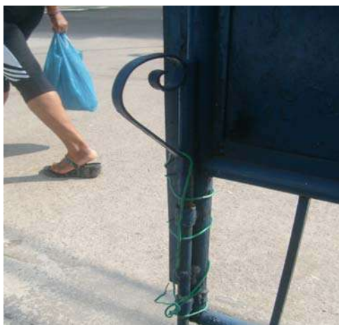
Fig 3: Improviso para fechar os portões que tem um sistema inadequado.

SERVIÇO PÚBLICO ESTADUAL PROCESSO Nº E-26/30.437/2011 DATA: 27/01/2010 Fls. _____ RUBRICA _____