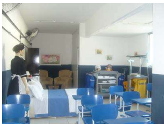
Fig. 25 – Sl de Camareira - Climatização da sala.