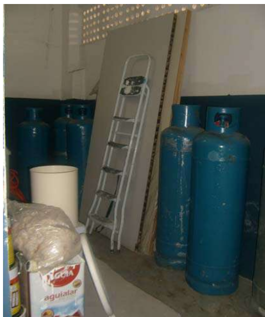
Fig. 15 - Botijão GLP armazenado em local inadequado.

SERVIÇO PÚBLICO ESTADUAL PROCESSO Nº E-26/36.914/2011 DATA: 28/06/2011 Fls. _____ RUBRICA _____