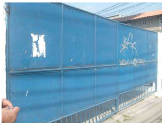
Fig 1: Portão Pixado